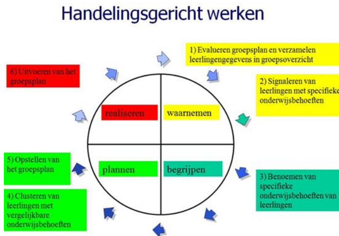
Figuur 1. Cyclus Handelingsgericht werken 1